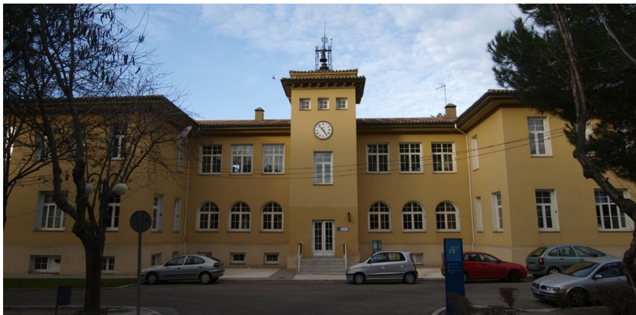
Salón de Actos. Instituto de Salud Carlos III

Instituto De Salud Carlos III C/ Sinesio Delgado 6, 28029 Madrid. Telf: 918 222 100